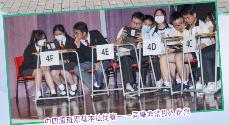
中四級班際基本法比賽——同學非常投入參與