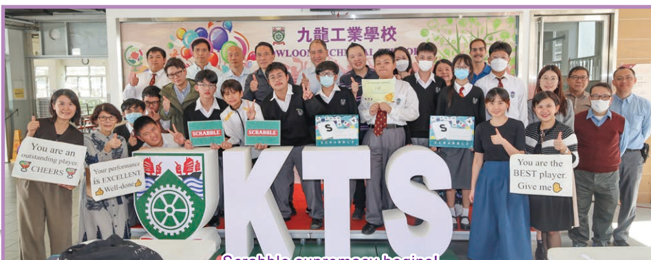
Scrabble supremacy begins!