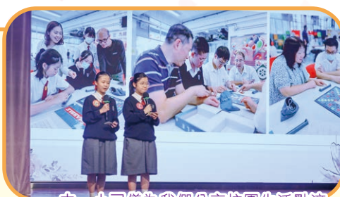
中一小司儀為我們分享校園生活點滴

2023/24學年家長教師會周年大會暨健康校園講座及家長教師座談會於2023年10月20日順利完成。當日共有100多名家長及教師出席，場面熱鬧。