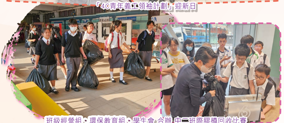
班級經營組・環保教育組・學生會 合辦 中二班際膠樽回收比賽