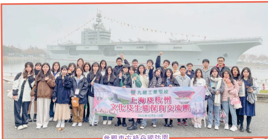
參觀東方綠舟國防園

是次活動讓我感受到上海杭州兩座城市的繁華與美麗，而最讓我印象深刻的環節是到訪浙江大學，一位學姐為我們講解浙江大學的歷史，分享自己在浙江大學的學習經歷與心得，並帶我們遊覽浙江大學校園，這次活動讓我認識到歷史悠久、聲譽卓著的浙江大學，同時也讓我學到許多知識，增加我個人對國民身份的認同與對國家的自豪感。