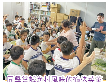
同學嘗試漁村風味的鶴佬菜茶

香港由開埠初期的漁村，演變為現在的「國際金融中心」，漁業是19世紀初香港主要的經濟基礎之一，是次活動有助增加學生對香港漁民文化及歷史的認識。