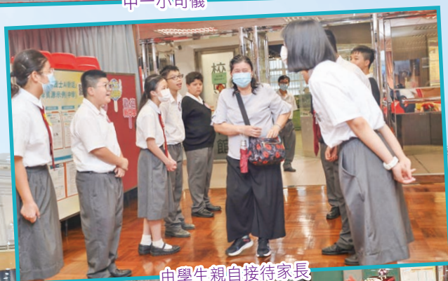
由學生親自接待家長