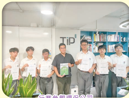
行業參觀環保公司