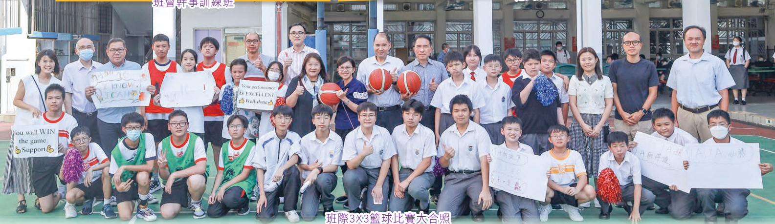
班際3X3籃球比賽大合照