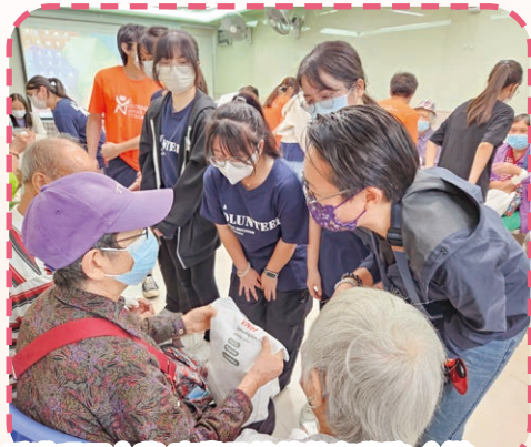
香港理工大學 專業及持續教育學院 合辦——青少年社區服務大使訓練計劃