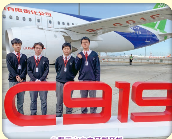
參觀國家自主研製飛機