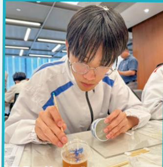
同學用精工細作於陶瓷杯上釉

本校4位修讀「設計與應用科技科」的中四同學參加了「心繫家國」活動：「築藝精粹，潮現當代」STEAM建築設計及藝術創作比賽。11月15日於香港故宮文化博物院舉行了一次陶瓷藝術工作坊，同學即場學習如何在陶瓷杯上釉，及後更燒製成色。同學透過是次工作坊，學習陶瓷製作並思考如何將這技術融入當代的建築，製作一件揉合傳統中國藝術及現代建築的特色設計。