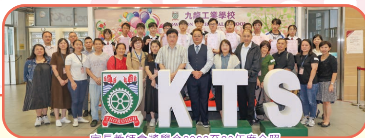
家長教師會獎學金2022至23年度合照