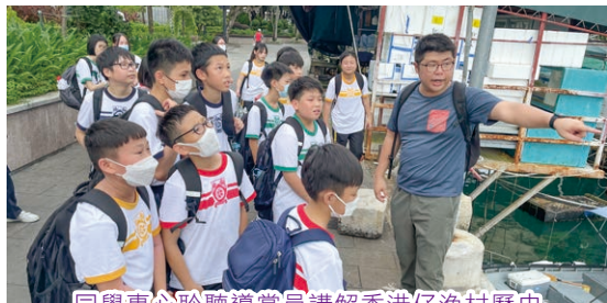
同學專心聆聽導賞員講解香港仔漁村歷史