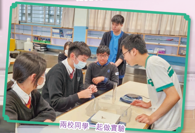
兩校同學一起做實驗