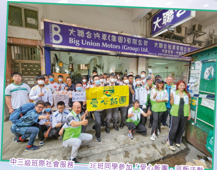
中三級班際社會服務——3E班同學參加「愛心飯團」派飯活動