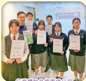
行業體驗參觀園境公司