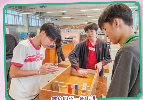
兩校同學一起上課

當天下午，兩校同學一同上課及體驗花式跳繩，其樂融融，甚至有友校的同學不捨離開，想留下與本校同學切磋籃球技呢！