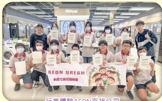
行業體驗AEON百貨公司