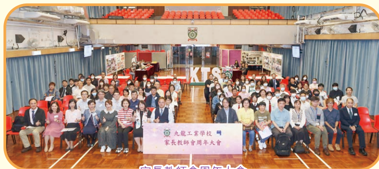
家長教師會周年大會