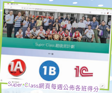
Super Class網頁每週公佈各班得分

本學年Super Class計劃推動全校學生參與不同組別活動。計劃活動豐富，上學期活動包括：「關愛大使-Super Coins」、「課室記錄冊」、「壁報設計比賽」、「校規問答比賽」、「杭州亞運會問答比賽」、「3人籃球比賽」、「圖書館借閱圖書記錄」及「中六戶外學習日影片創作比賽」等。同學積極參與，時常主動協助老師和工友，贏取Super Coins以增加班得分。各班展現了合作共贏、積極團結及互助關愛的精神。