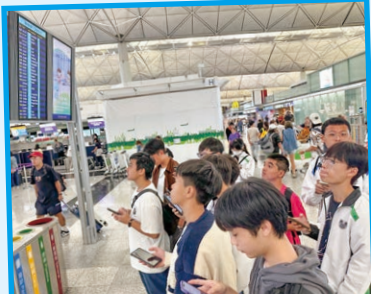
同學要從機場的航班資料板上，找出特定航班的資料。