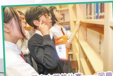
中一校園定向問答比賽——同學正在圖書館完成指定任務

本組為了加強各級班主任之間的聯繫，成員每月會與各級班主任舉行會議，以了解和跟進各班同學在學習、操行和社交方面的情况。