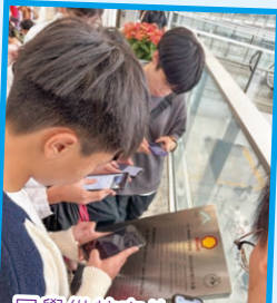
同學從特定的CHECK POINT，找出及認識香港機場的發展史。

中五級APL（應用學習課程）修讀航空學的同學，於10月28日到香港國際機場的客運大樓參觀，了解機場基本運作及各項出入境設施，並透過手機即時掃描QR CODE，於機場進行定向活動，找出與機場相關的歷史。