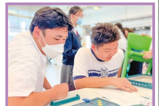
Unleash your inner wordsmith!

With a competitive field and a crowd that appreciates the strategic intricacies of the game, the Inter-Class Scrabble Competitions draw enthusiasts who are hungry for victory. Congratulations to 1E, 2B and 3D.