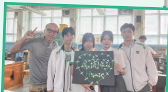
初步成品，期待歌唱比賽時亮燈為同學打氣