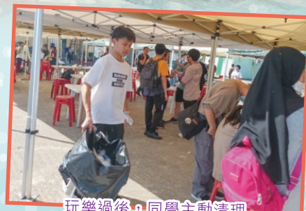
玩樂過後，同學主動清理