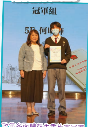
政策多面體報告書比賽冠軍