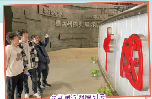
參觀重兵器陳列展

為了讓學生親身了解國情和國家的最新發展，2023年12月9日至13日，由3位教師帶同30位學生到上海及杭州交流。到訪東方綠舟國防園、中華藝術宮、上海歷史博物館、京杭大運河、杭州夢想小鎮及西湖等不同景點，通過參觀學習，讓學生知道國家安全及維護國家安全的重要性；培養學生愛國情懷及了解國家在生態保育的成果，並增進他們對中華文化的認識和欣賞、提升國民身份認同。