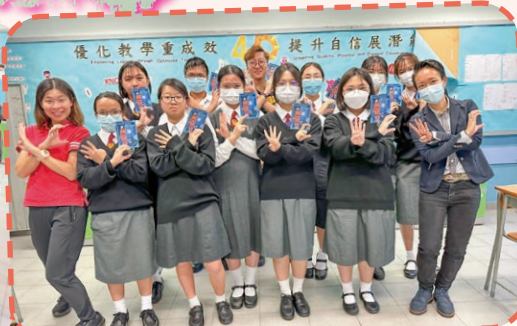
「4C青年義工領袖計劃」迎新日