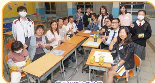
家長與班主任會談