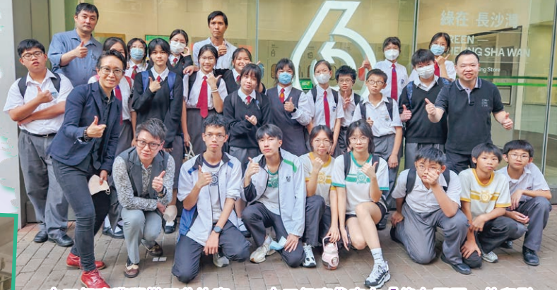
中二級班際膠樽回收比賽——中二級班代表在「綠在區區」外留影