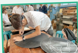
四社同學分別為各社製作及設計LED燈打氣牌