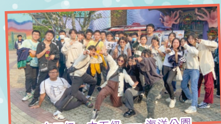
中二級、中五級 — 海洋公園