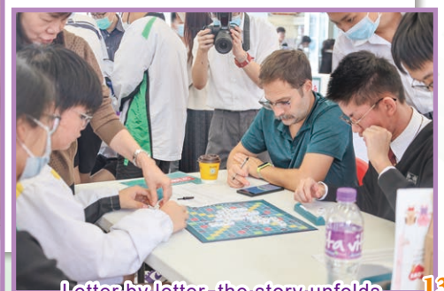
Letter by letter, the story unfolds.