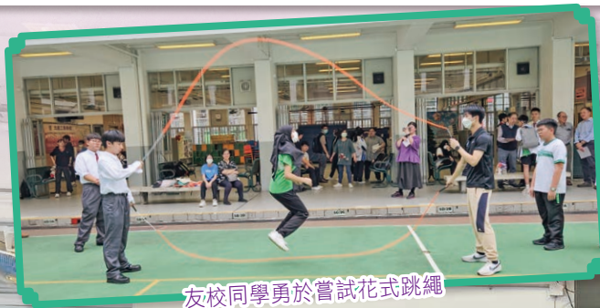
友校同學勇於嘗試花式跳繩