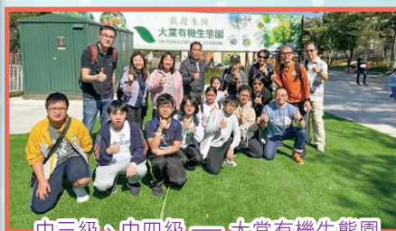
中三級、中四級 — 大棠有機生態園