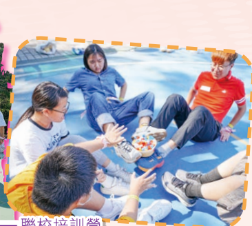
「4C青年義工領袖計劃」——聯校培訓營