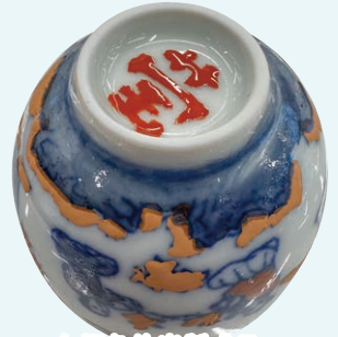
上好色的半製成品，期待燒製後的成品