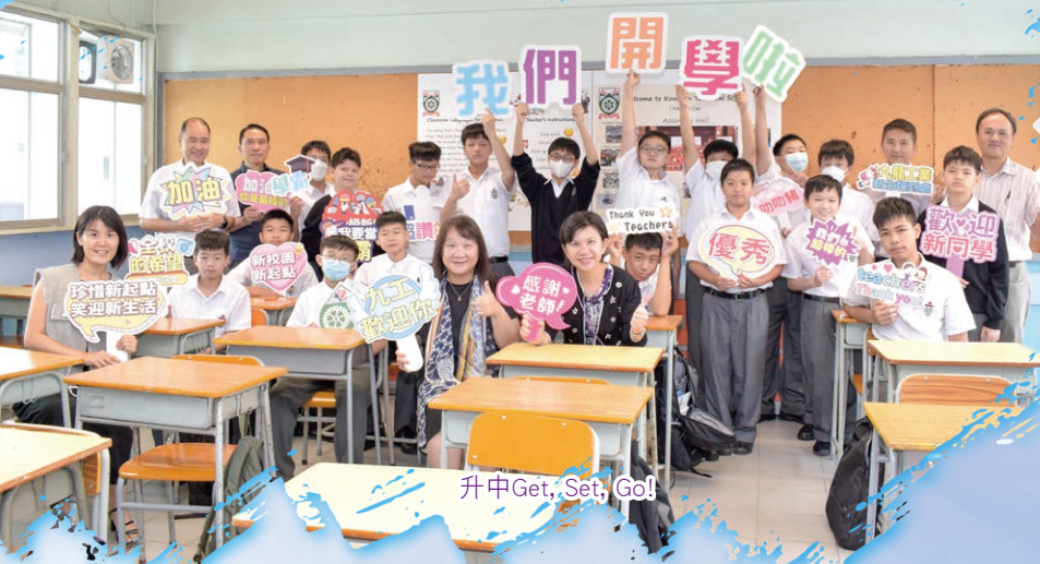
升中Get, Set, Go!