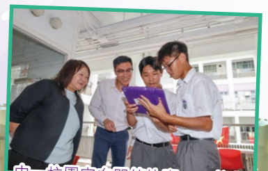
中一校園定向問答比賽——校長協助同學完成指定任務