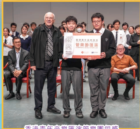
香港青年音樂匯演管樂團銀獎

由音樂事務處主辦，「2023香港青年音樂匯演——管樂團匯演」於12月舉行。本校管樂團於本年賽事中獲得初級組銀獎。