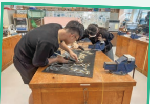
同學於學校工場，運用設計與科技科所學製作燈牌