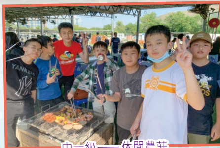
中一級 — 休閒農莊