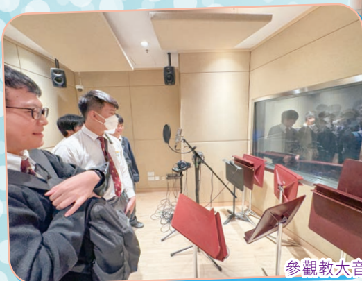
參觀教大音樂錄音室

經過這次參與香港教育大學音樂課程講座與參觀大學音樂部，令我更了解課程的入學要求、課程內容與校園生活。更重要是令我體會到以音樂為將來的升學並不只是圍繞於演奏樂器，而是可以有更多不同的出路作選擇，如音樂製作、教育及藝術行政的工作。