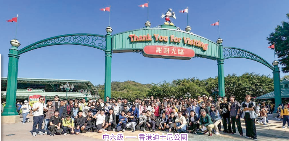
中六級 — 香港迪士尼樂園

多元學習日不僅讓我們走出了教室學習，更讓我們有機會在生活中實踐我們的價值觀。最後，讓我們一起期待下一個多元學習日，讓學習和價值觀成為我們生活的一部分，為我們的未來指引方向！