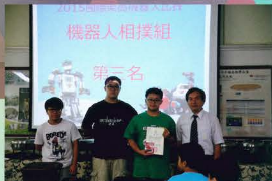
2015年國際樂高機器人比賽 機械人相撲組第三名