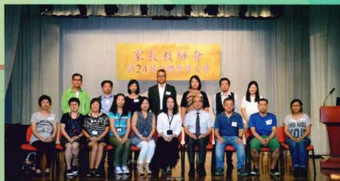
家長教師會第二十四屆全體會員大會(24/10/2015)