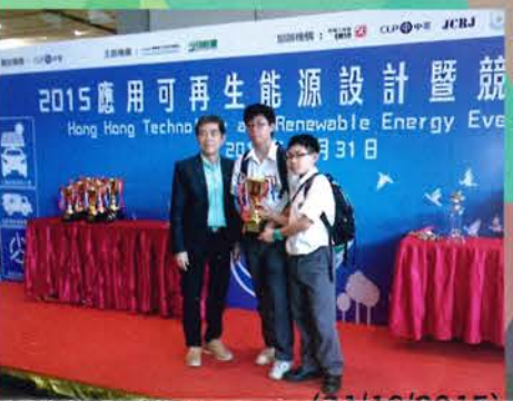
2015應用可再生能源設計暨競技大賽 手搖發電機智能機械模型車挑戰賽(亞軍) 手搖發電機超級電容模型車大賽(一等獎)