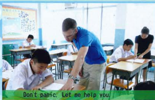
Don't panic. Let me help you.