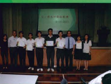
中一學長計畫啟動禮(6/10/2015)