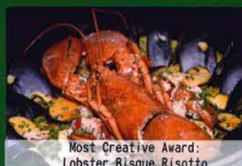
Most Creative Award: Lobster Bisque Risotto

The school hall was filled with aroma of delicacies and faces of joy on 6th July 2015. A total of fourteen teams participated in the KTS Healthy Cooking Contest 2015. Dishes were judged based on six key areas: taste, nutrition, garnishing, creativity, oral presentation and value for money. The event was not just a cooking contest but also a place of gourmet and taste. Teachers and students had a great time and most important of all, their taste buds were satisfied!