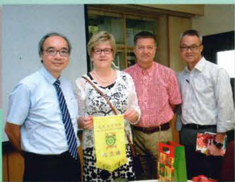
芬蘭赫爾辛基高中語言學校校長探訪我校 (15/10/2015)