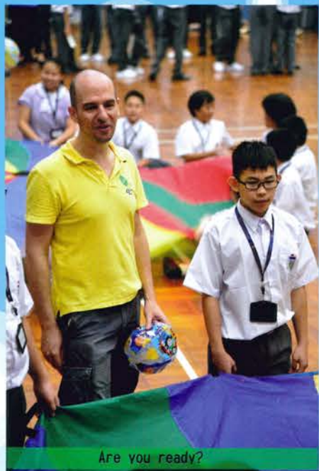
Are you ready?

The Summer English Bridging Programme was held on 18 August, 2015. The new S1 students were exhilarated when they met the English-speaking tutors at Kowloon Technical School, a place where they are going to spend the next 6 years. The programme was held to immerse the newcomers in a language-rich environment. Through games, students moved out from their comfort zone and were no longer shy to raise questions in simple English and communicate with their English tutors and fellow classmates.