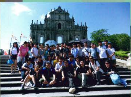
澳門歷史城區文化之旅(26/6/2015)