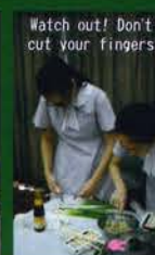
Watch out! Don't cut your fingers!