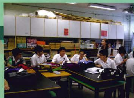
「做個CEO 商業營運」——配合資優教育活動