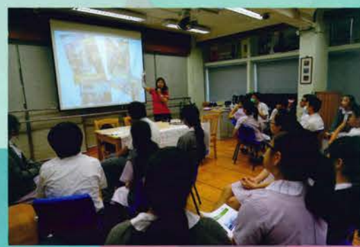
4C 青年義工領袖計劃——迎新日 (23/10/2015)