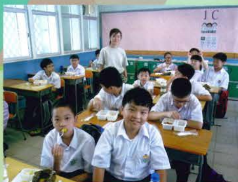
中一留校午膳活動