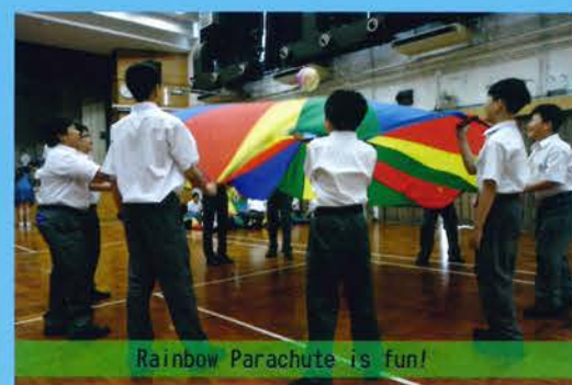
Rainbow Parachute is fun!