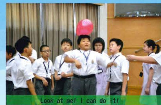
Look at me! I can do it!