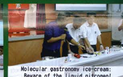
Molecular gastronomy ice-cream: Beware of the liquid nitrogen!