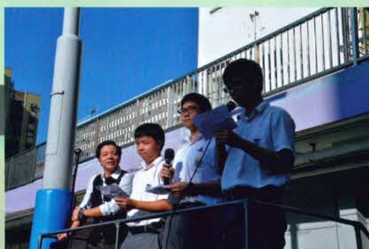
晨曦傳語——學生作早會分享