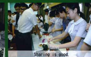
Sharing is good.