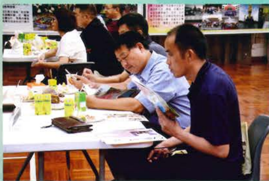
湖南湘西教育管理研討班(22/9/2015) 一行38位來自湖南省湘西州政府與7個縣的教育部門領導及中小學校長到訪本校