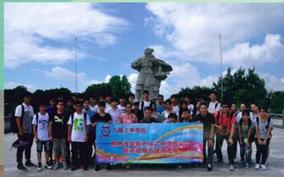
跨科考察東莞袁崇煥紀念館 (26/10/2015)