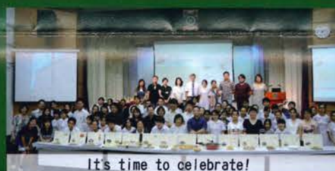
It's time to celebrate!