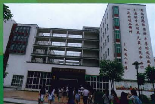
聯校活動「茶是故鄉濃——廣西賀州歷史文化雙向交流」(16/7-19/7/2015)