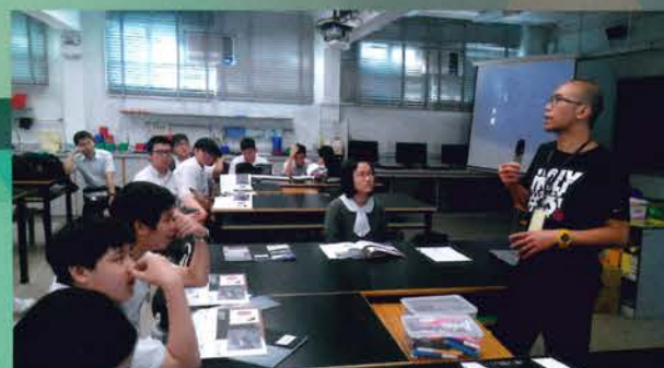
《龔·當代香港攝影》展覽暨講座(6/10-16/10/2015)