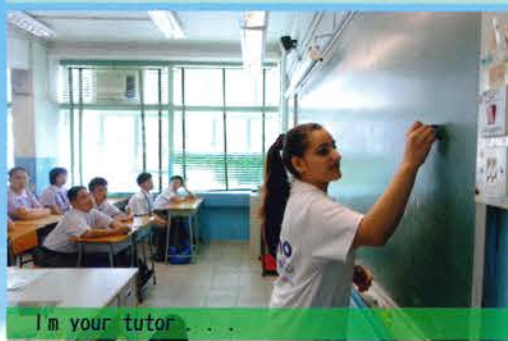
I'm your tutor...

The Summer English Bridging Programme was held on 18 August, 2015. The new S1 students were exhilarated when they met the English-speaking tutors at Kowloon Technical School, a place where they are going to spend the next 6 years. The programme was held to immerse the newcomers in a language-rich environment. Through games, students moved out from their comfort zone and were no longer shy to raise questions in simple English and communicate with their English tutors and fellow classmates.