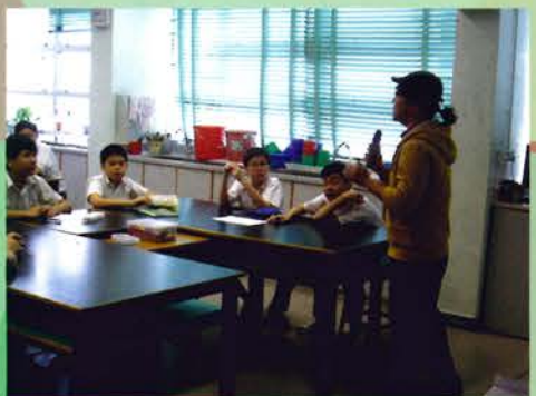
當個少年律師——口才及思維訓練活動