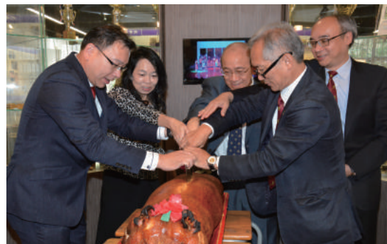
「切燒豬儀式」是傳統習俗， 開啟逾半世紀九工科技教育的未來。