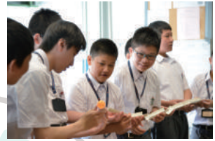
Don't drop the ball!