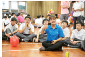
You are great!