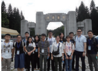
黃花崗72烈士陵門廊