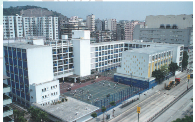
進入千禧年代，本校初中部與高中部連成一體。