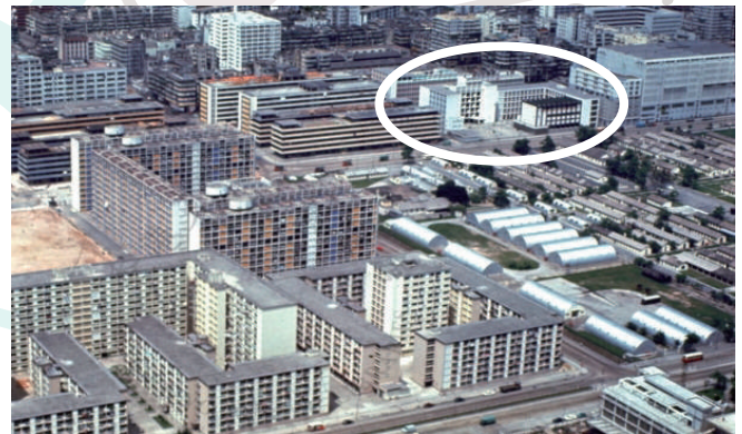
七十年代初的長沙灣，仍見本校對面的軍營。