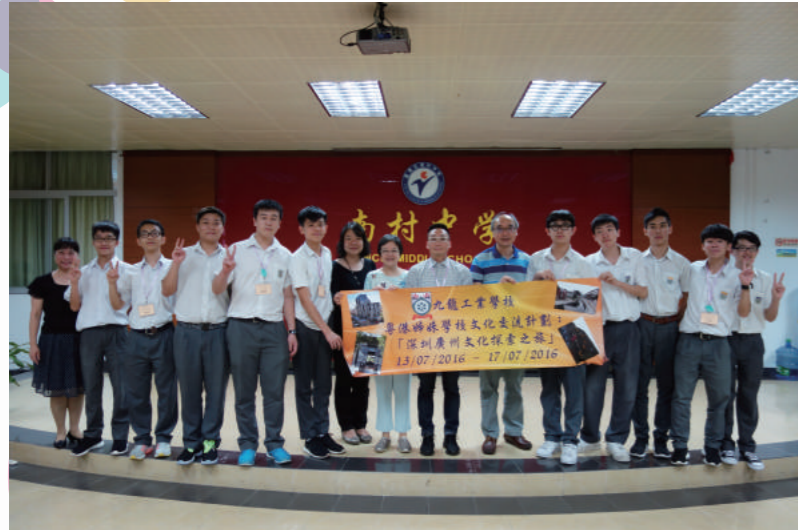
深圳廣州文化探索之旅(13-17/7/2016)