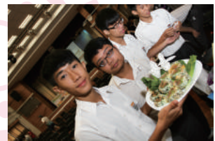
Healthy Sushi Rolls