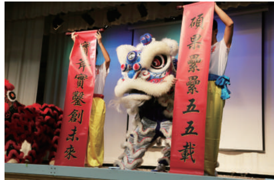
五十五周年校慶啟動禮的高潮。