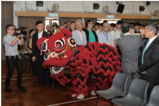
啟動禮上各人視線不同，心所繫都是九工。