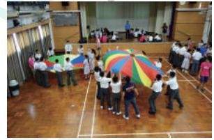
Fly! Let it Fly!