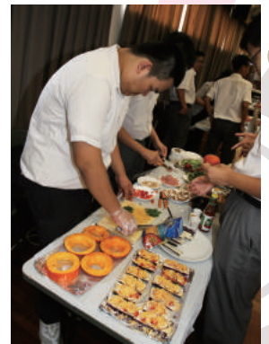
Let's cut the pumpkin