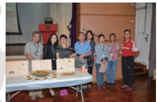
The Judging Panel