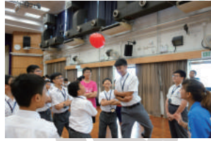
Eyes on the balloon!