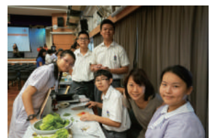
We are MasterChef KTS!