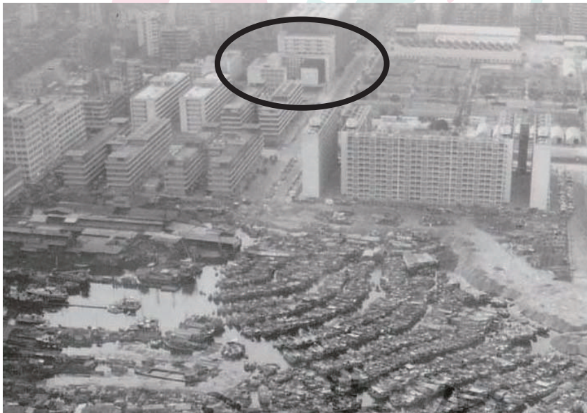
六十年代長沙灣道至東京街方向已是海邊，中電和本校在軍營對面。