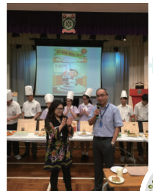
The winner is ...