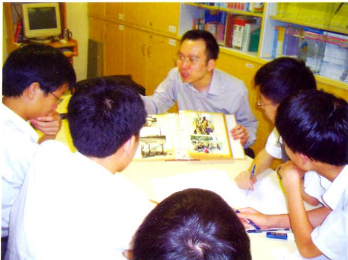
向師弟講解無國界醫生的工作情況